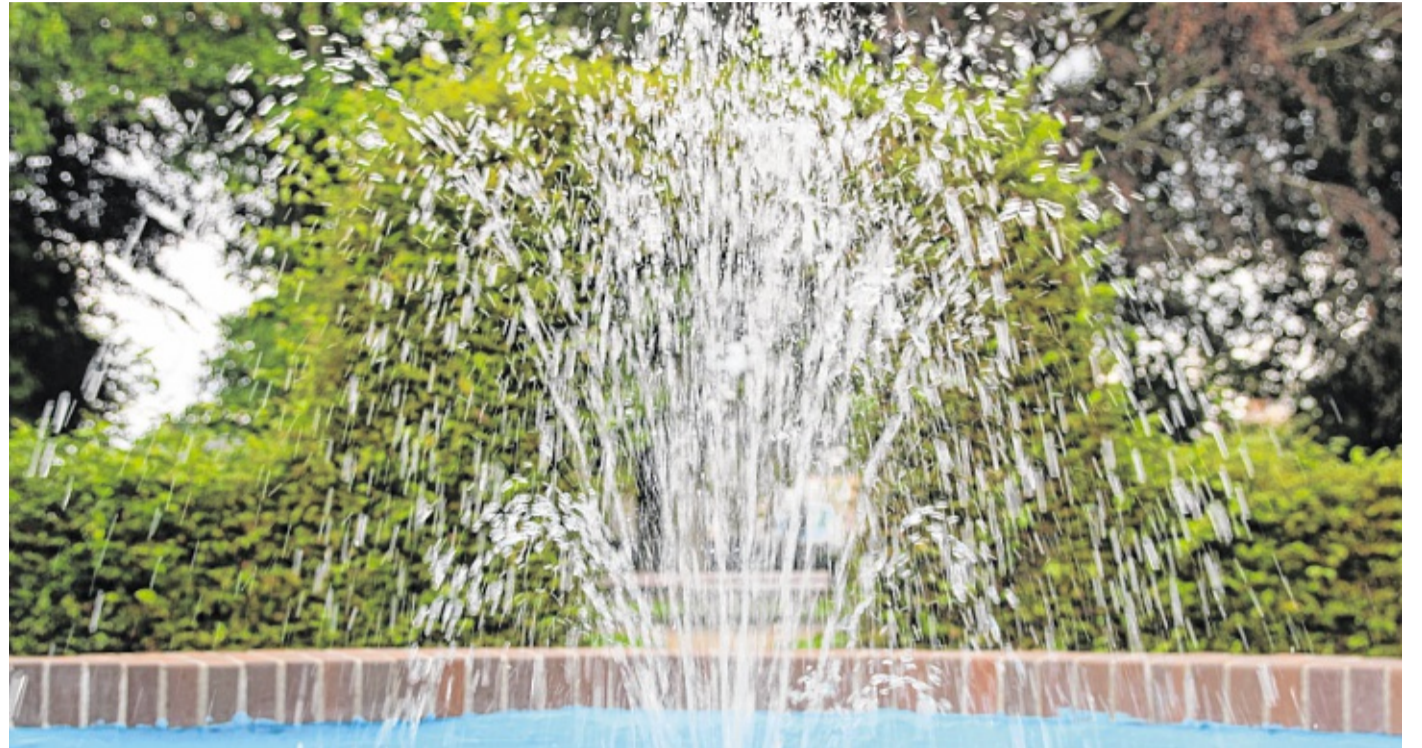
Parknutzungskonzept: Die SPD will den Grünanlagen der Stadt mehr Bedeutung verschaffen. Das soll sowohl dem Tourismus als auch der Naherholung zugute kommen.

„Wir wollen keine Einzelanträge stellen, die dann zeredet werden“, erläutert Holger Jessen, warum es ein Gesamtkonzept sein soll. Ist es der ganz große Wurf für die Stadt? Erst einmal müssen die Genossen